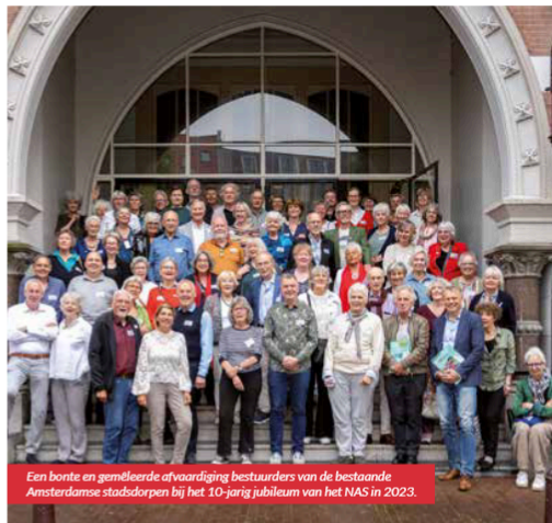
Een bonte en gemêleerde afvaardiging bestuurders van de bestaande Amsterdamse stadsdorpen bij het 10-jarig jubileum van het NAS in 2023.

Wel eens van gehoord, stadsdorpen? Amsterdam telt er maar liefst 35, waarvan zes in stadsdeel Zuid. Wat het is? Een buurtschap om de saamhorigheid en de sociale cohesie in de buurt te vergroten. 'De vrijheid en het bruisende van de stad, de betrokkenheid en kleinschaligheid van een dorp' is het motto.